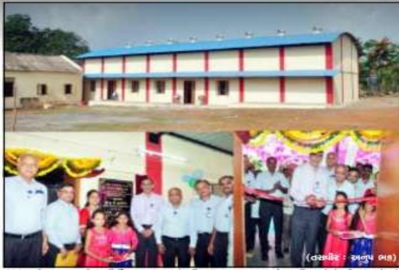
વ્યારાના બેડકુવાદૂર ખાતે નવનિર્મિત અણુમથક સાંસ્કૃતિક ભવન, મધ્યાહન ભોજન કિચનનું લોકાર્પણ કરવાયું હતું.