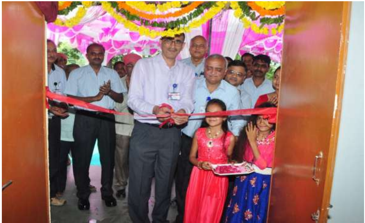
लाल फीता काट के सभागार मे प्रवेश Entry in to Assembly hall by cutting of red ribbon