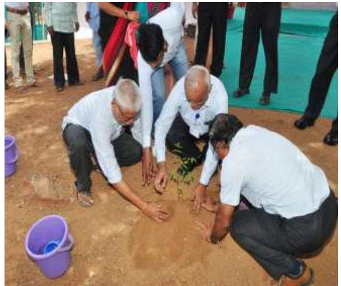
उदघाटन समारोह के बाद वृक्षारोपण Tree Plantation after the inauguration function