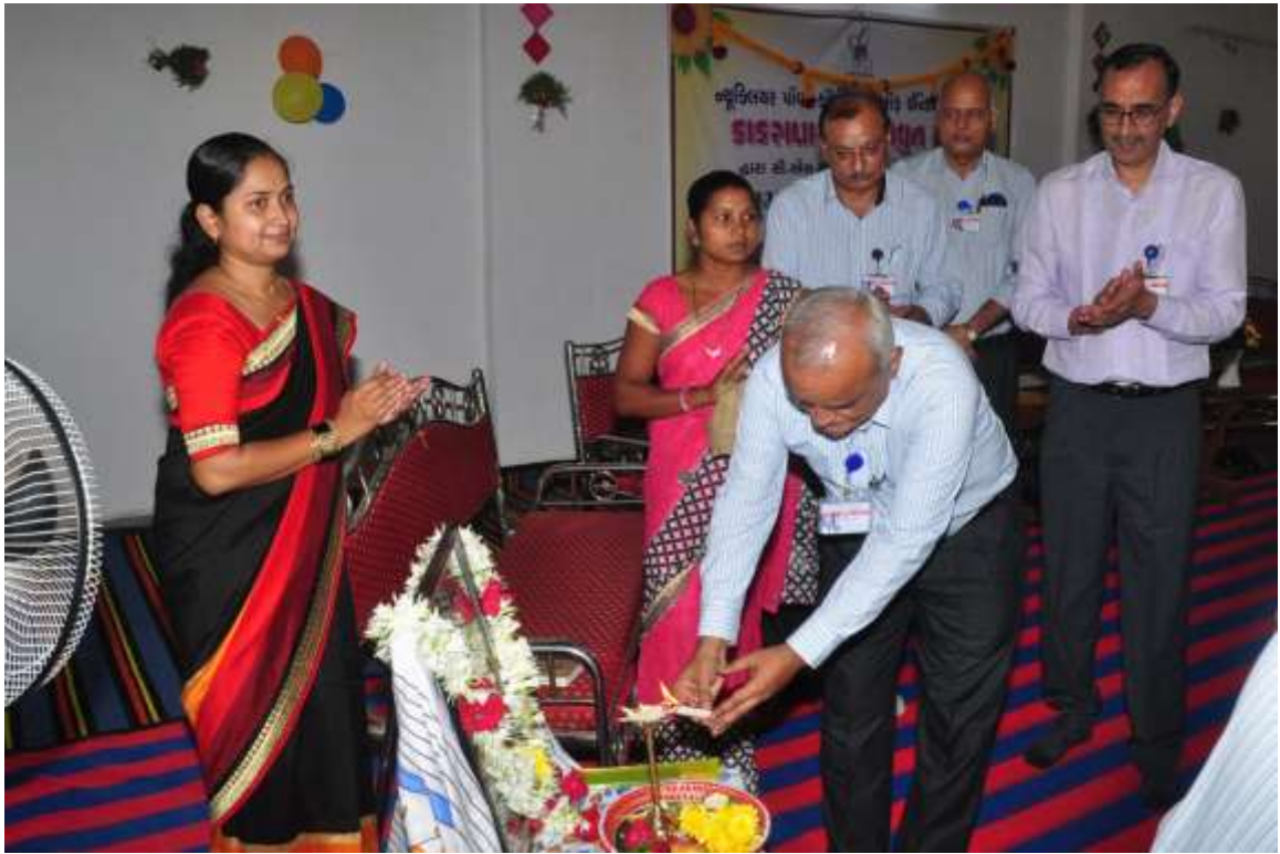
दीप प्रज्वलन Lamp lighting ceremony