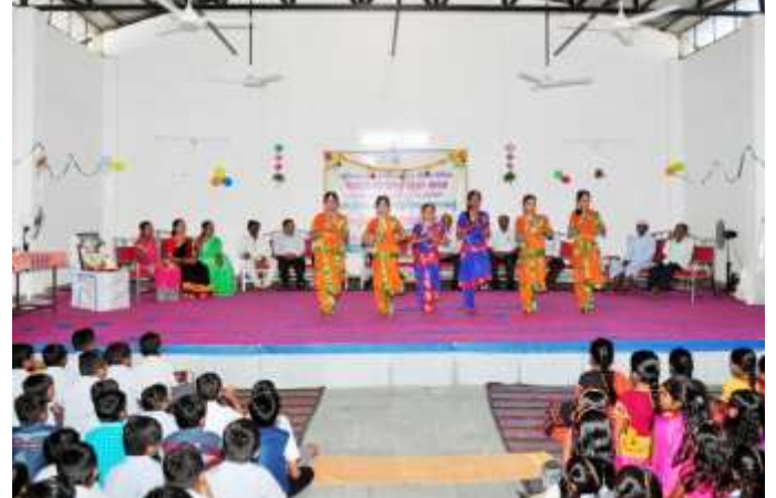
संस्कृतिक कार्यक्रम प्रस्तुत करते विद्यार्थी The Cultural event performed by students