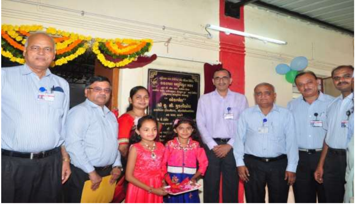
तक्ति का अनावरण Inauguration