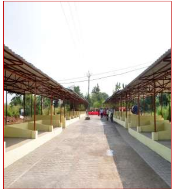
अणुमथक हाट बाजार का एक दृश्य A View of Anumathak Haat Bazaar